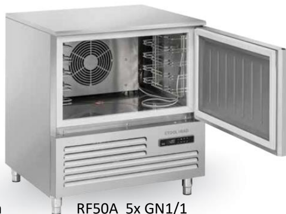
RF50A 5x GN1/1