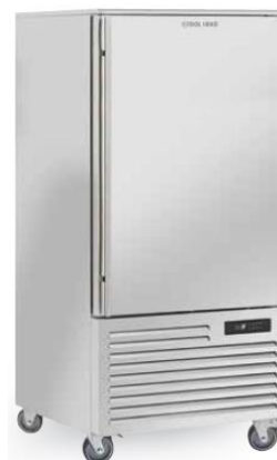
15x GN1/1 RF150A