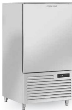
10x GN1/1 RF100A