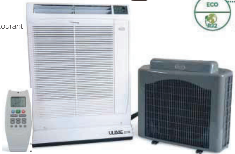
Télécommande digitale programmable